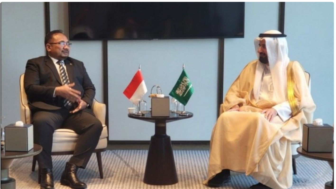
Menag Yaqut bertemu Menteri Haji Arab Saudi Tawfiq F. Al Rabiah, di Jeddah.

JAKARTA - Indonesia dan Pemerintah Kerajaan Arab Saudi telah menandatangani kesepakatan penyelenggaraan ibadah haji 1444 H/2023 M. Kesepakatan tersebut ditandatangani hari ini oleh Menag Yaqut Cholil Qoumas bersama Menteri Haji dan Umrah Arab Saudi Tawfiq F Al Rabiah di Jeddah.